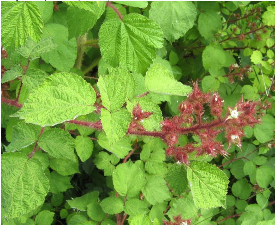
Listy – střídavé

Květy – oboupohlavné, pětičetné, s kalichem a korunou